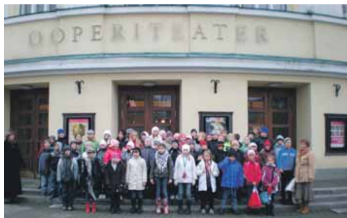
3.–5. klasside õpilased ja õpetajad Estonia teatri ees.

MTÜ Harju Kalandusühingu strateegia täiestekst on leitav: www.harjukalandus.ee